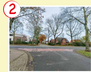
2 An der Beeke Straßenüberquerung

→ Sicherer Weg über die Bedarfsampel an der Polizeistation