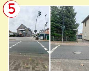
5 Leester Straße

→ Sicherer Weg über die Bedarfsampel bei Bäckerei Weymann