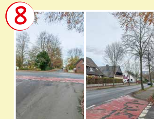
8 Mittelweg Straßenüberquerung

→ Sicherer Weg über die Bedarfsampel an Schulstraße oder Bäckerweg