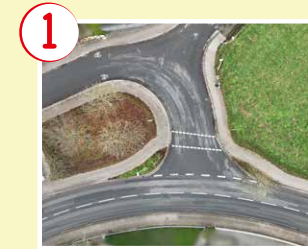
1 Tankstelle Mühlenkamp unübersichtliche Kreuzung