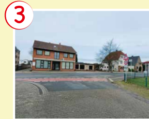
3 Westermoor Straßenüberquerung

→ Sicherer Weg über die Bedarfsampel an der Polizeistation